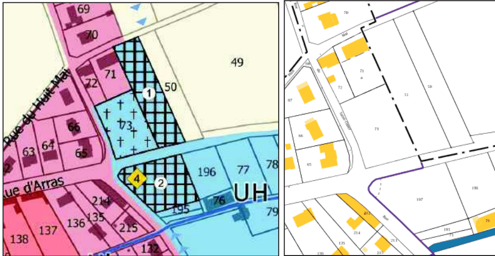
Extrait du plan de zonage de la commune de Berneville et extrait du cadastre